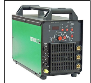
TETRIX 300 DC