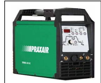
TETRIX 270 DC

30310065 GRUPO TETRIX-351 W DC "SYNERGIC". ACTIVARC. Refrigerado por agua